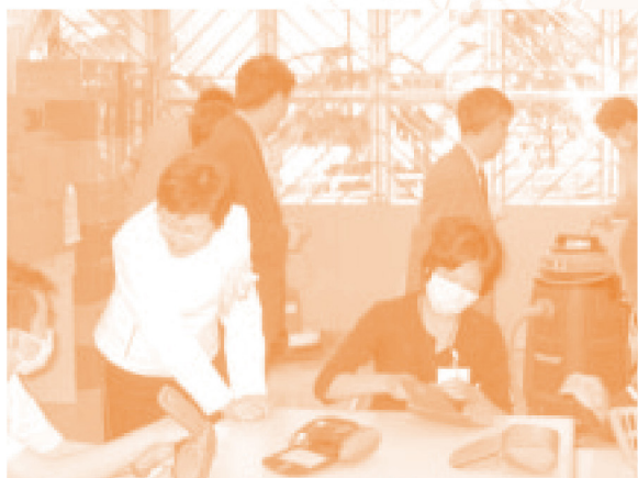
◆林鄭月娥太平紳士除主持開幕典禮外，亦參觀工場及了解工友的工作情況

日，讓更多人認識殘疾人士及肯定他們的能。當日真是非常熱鬧，除邀請了社會福利署署長林鄭月娥太平紳士及屯門區區議會副主席梁建文先生到來剪綵外，更有很多的行家來參與，互相交換心得及學習，使展毅中心生色不少。在各同事的合作及積極籌備下，再加上工友們的優良表現，使開幕典禮及開放日成功地完成，在此要衷心感謝他們。