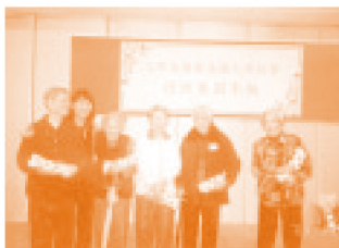
◆ Participants were glad to receive gifts in the party.

About 260 service users joined the New Year dinner parties held in Chinese restaurants at Wong Tai Sin, Tze Wan Shan and Wang Tau Hom on January 8, 16 and 20 respectively. Guests, staff and service users sang songs and danced during the party. Highlights of the party included lucky draw and performances by guests. Everyone had an enjoyable evening.