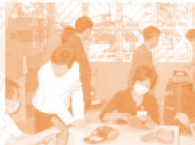
◆ Mrs Carrie Lam toured around the Centre and the trainees shared their working experience with her.