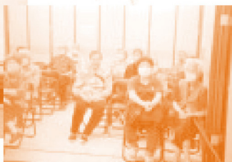
◆ The participants listened attentively to the speaker.