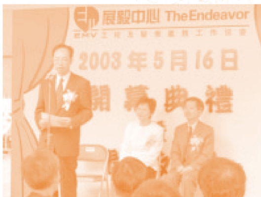
◆開幕禮由主席陳帆先生(左)、社會福利署署長林鄭月娥太平紳士(中)及屯門區區議會副主席梁建文先生主持。