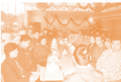
◆參加的工友秩序井然地進入酒店及安坐在預留的位置，等待春茗的開始