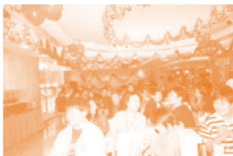
◆工友不但慶賀農曆新年的來臨，也順道歡度情人節